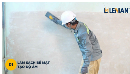
01 LÀM SẠCH BỀ MẶT TAO ĐỘ AM