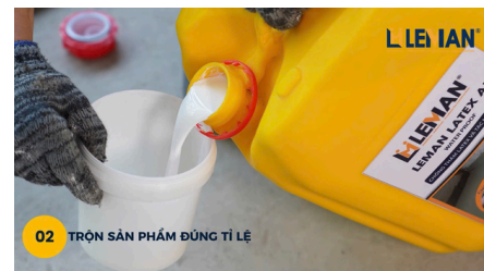
02 TRỘN SẢN PHẨM ĐÚNG TỈ LỆ