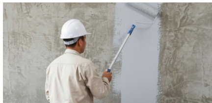
Bước 3: Quét Latex lên bề mặt