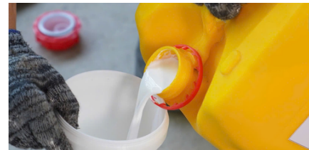
Bước 2: Đổ Latex ra xô đựng