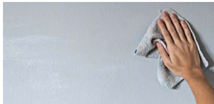
Bước 1: Làm sạch bề mặt