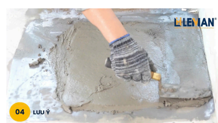
04 LƯU Ý