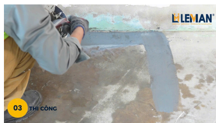
03 THI CÔNG